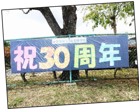
色紙で作った外看板(校門脇)