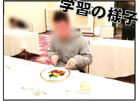
高等部 テーブルマナー