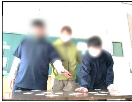
中学部 かるた取り