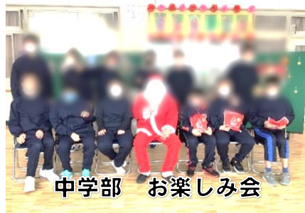
中学部 お楽しみ会