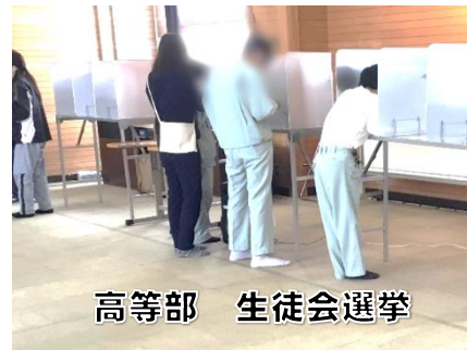
高等部 生徒会選挙