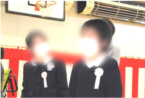
小・中学部入学式

今年度の新入生は小学部6名、中学部6名、高等部15名でした。入学式は、感染症対策として、小・中学部と高等部に分け、外部からの来賓を招かず、内容を短縮して実施しました。緊張気味の児童生徒も見受けられましたが、改修工事を終えて新しくなった体育館で、新入生は迫支援学校での第一歩を踏み出しました。また、入学式に先立ち第1学期始業式が行われました。各学部の最高学年の児童生徒が新学期の抱負を発表しました。高等部3年の〇〇〇〇さんは、「木工班で毎日の製品作りを集中して丁寧に取り組みたい。」と話しました。また、校長からは、全校児童生徒に向けて「目標をもってチャレンジしてほしい。」「自分から元気に挨拶してほしい。」と話がありました。