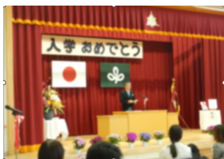
小・中学部入学式

また、21日(金)には、授業参観と3年ぶりとなるPTA総会を実施いたしました。場を共にし、顔を合わせて行うことの大切さを改めて感じました。保護者の皆様には、御多用のところ来校いただきありがとうございました。